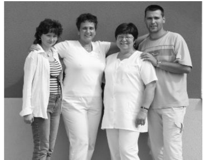
A PROSYS GYÓGYSZERTÁR CSAPATA